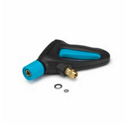
Nilfisk Ergo 2000 Standard - vysokotlaká pistole s otočnou spojkou