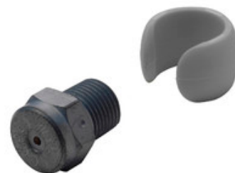
Vysokotlaká tryska Nilfisk Tornado Plus 0680