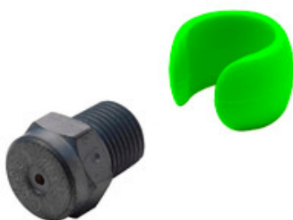
Vysokotlaká tryska Nilfisk Tornado Plus 0550