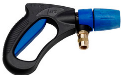
Nilfisk Ergo 3000 - pistole s aretací