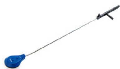
Nilfisk rotační kartáč s tryskou 055 a nástavcem 1700mm