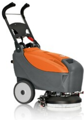
TSM Grande Brio 35 E