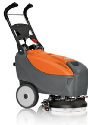
TSM Grande Brio 35 B Lithium