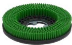
Diskový kartáč TSM 350mm PPL 0,4