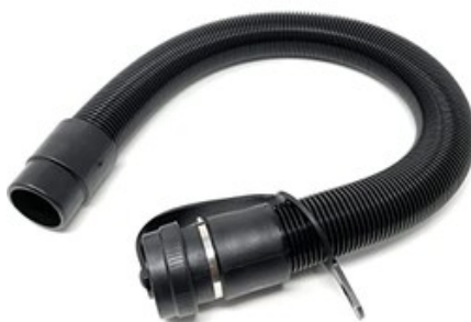
Vypouštěcí hadice pro podlahový mycí stroj TSM Grande Brio 35