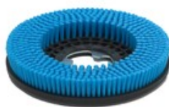
Diskový kartáč TSM 350mm PPL 0,3