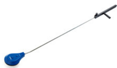
Nilfisk rotační kartáč s tryskou 055 a nástavcem 1700mm