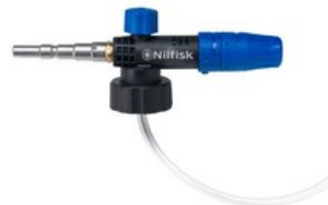
Nilfisk napěňovací nástavec Vario (960-1440 l/hod)