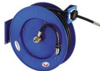
Nilfisk samonavíjecí buben pro vysokotlakou hadici