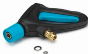
Nilfisk Ergo 2000 Standard - vysokotlaká pistole s otočnou spojkou