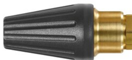
Vysokotlaká rotační tryska ST-458.1 200 (250bar)