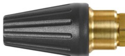
Vysokotlaká rotační tryska ST-458.1 130 (250bar)