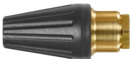
Vysokotlaká rotační tryska ST-458.1 150 (250bar)