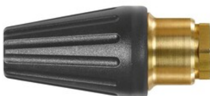
Vysokotlaká rotační tryska ST-458.1 180 (250bar)