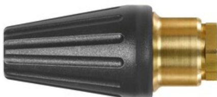
Vysokotlaká rotační tryska ST-458.1 120 (250bar)