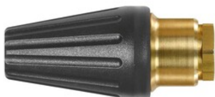
Vysokotlaká rotační tryska ST-458.1 250 (250bar)