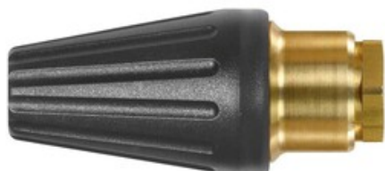
Vysokotlaká rotační tryska ST-458.1 110 (250bar)