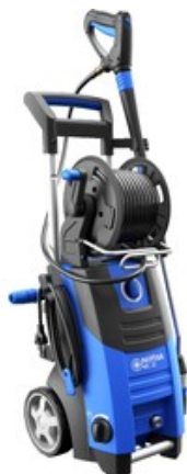
Nilfisk MC 2C-120/520 XT