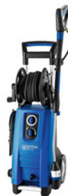
Nilfisk MC 2C-150/650 XT