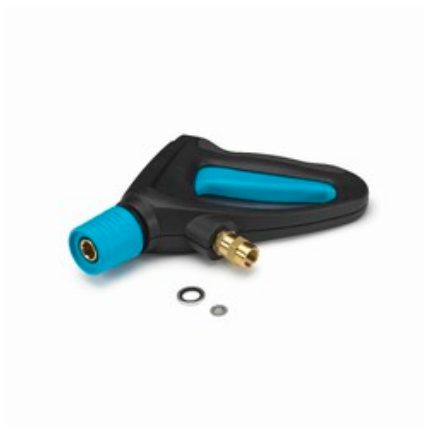
Nilfisk Ergo 2000 Standard - vysokotlaká pistole s otočnou spojkou