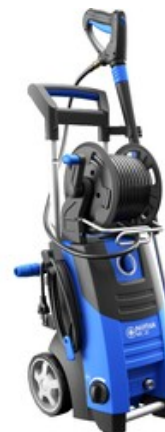
Nilfisk MC 2C-140/610 XT