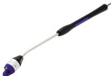
Nilfisk 4-IN-1 nástavec s tryskami 0370