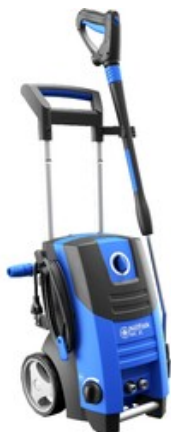
Nilfisk MC 2C-120/520 T