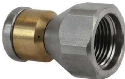
Vysokotlaká rotační kanalizační tryska 250bar 3/8" ST-49.1 (045)