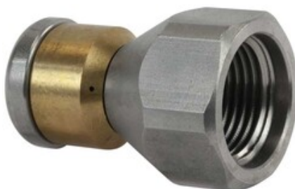
Vysokotlaká rotační kanalizační tryska 250bar 3/8" ST-49.1 (080)