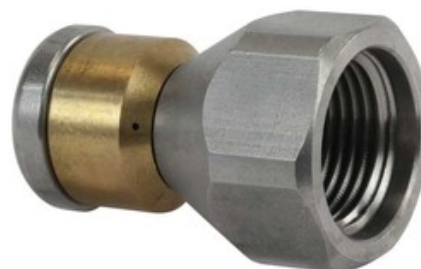
Vysokotlaká rotační kanalizační tryska 250bar 3/8" ST-49.1 (100)