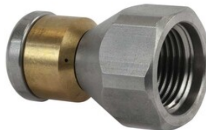
Vysokotlaká rotační kanalizační tryska 250bar 3/8" ST-49.1 (050)