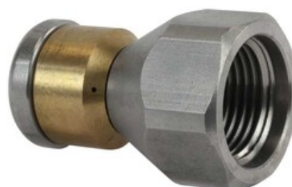
Vysokotlaká rotační kanalizační tryska 250bar 3/8" ST-49.1 (200)