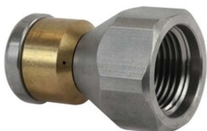
Vysokotlaká rotační kanalizační tryska 250bar 3/8" ST-49.1 (120)