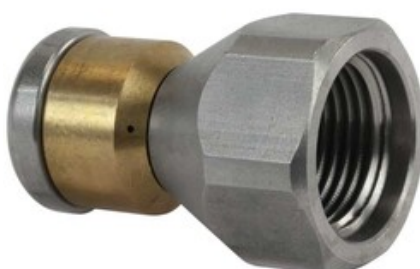
Vysokotlaká rotační kanalizační tryska 250bar 3/8" ST-49.1 (150)