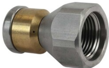
Vysokotlaká rotační kanalizační tryska 250bar 3/8" ST-49.1 (040)