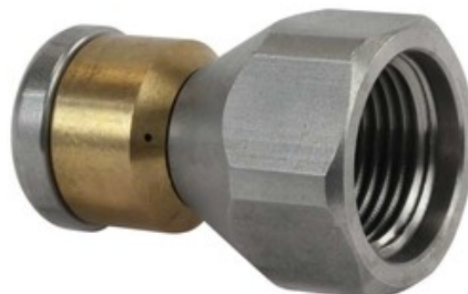
Vysokotlaká rotační kanalizační tryska 250bar 3/8" ST-49.1 (050)