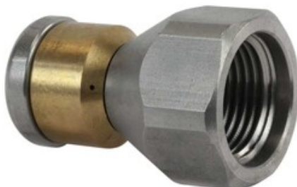
Vysokotlaká rotační kanalizační tryska 250bar 3/8" ST-49.1 (045)