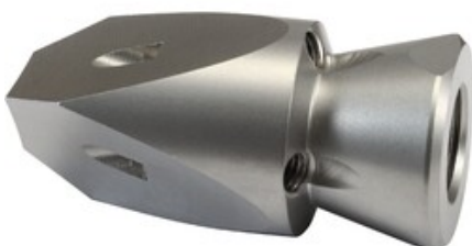
Vysokotlaká kanalizační tryska 350bar 1/4" ST-49 frézovací 4+3 (050) 50mm