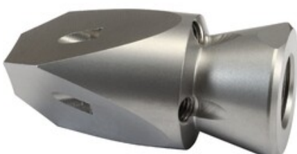
Vysokotlaká kanalizační tryska 350bar 1/4" ST-49 frézovací 4+4 (070) 50mm