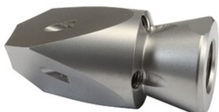
Vysokotlaká kanalizační tryska 350bar 1/4" ST-49 frézovací 4+4 (150) 50mm