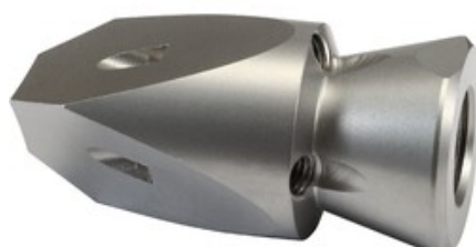
Vysokotlaká kanalizační tryska 350bar 1/4" ST-49 frézovací 4+4 (080) 50mm