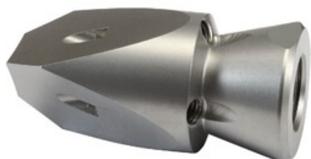
Vysokotlaká kanalizační tryska 350bar 1/4" ST-49 frézovací 4+4 (120) 50mm