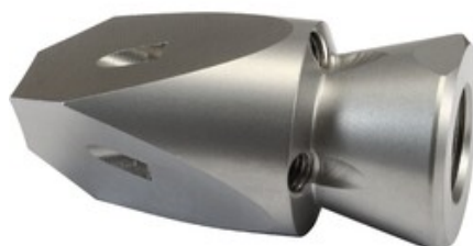
Vysokotlaká kanalizační tryska 350bar 1/4" ST-49 frézovací 4+3 (045) 50mm