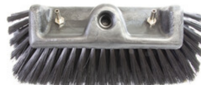
Mycí kartáč pro nízkotlaký teleskopický nástavec (1.90-10.00m)