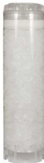
Polyfosfátová vložka vodního filtru 5" malá