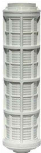
Vložka vodního filtru 5" malá