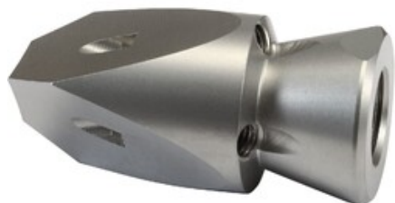
Vysokotlaká kanalizační tryska 350bar 1/4" ST-49 frézovací 4+4 (120) 50mm