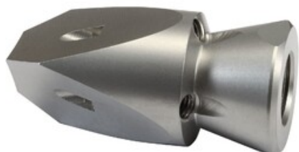
Vysokotlaká kanalizační tryska 350bar 1/4" ST-49 frézovací 4+4 (150) 50mm