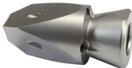
Vysokotlaká kanalizační tryska 350bar 1/4" ST-49 frézovací 4+3 (045) 50mm