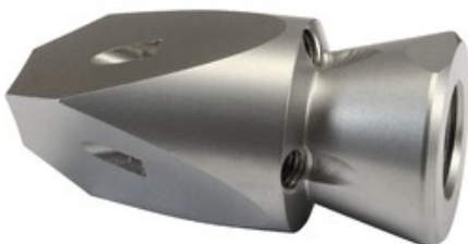
Vysokotlaká kanalizační tryska 350bar 1/4" ST-49 frézovací 4+3 (050) 50mm