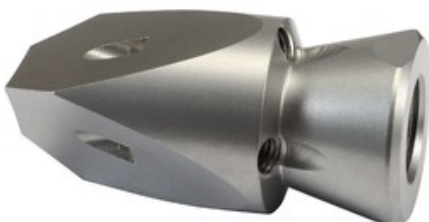
Vysokotlaká kanalizační tryska 350bar 1/4" ST-49 frézovací 4+4 (070) 50mm