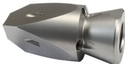
Vysokotlaká kanalizační tryska 350bar 1/4" ST-49 frézovací 4+4 (080) 50mm