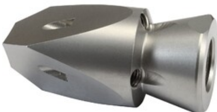
Vysokotlaká kanalizační tryska 350bar 1/4" ST-49 frézovací 4+4 (200) 50mm