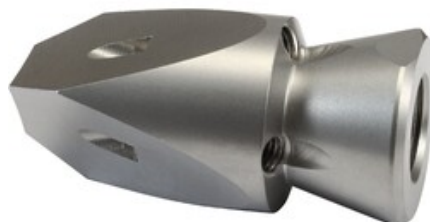
Vysokotlaká kanalizační tryska 350bar 1/4" ST-49 frézovací 4+4 (060) 50mm