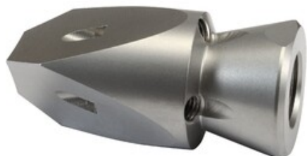
Vysokotlaká kanalizační tryska 350bar 1/4" ST-49 frézovací 4+3 (055) 50mm