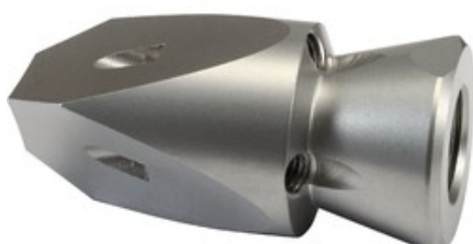
Vysokotlaká kanalizační tryska 350bar 1/4" ST-49 frézovací 4+4 (100) 50mm