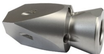
Vysokotlaká kanalizační tryska 350bar 1/4" ST-49 frézovací 4+4 (120) 50mm