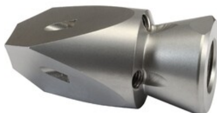
Vysokotlaká kanalizační tryska 350bar 1/4" ST-49 frézovací 4+4 (080) 50mm