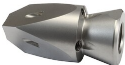
Vysokotlaká kanalizační tryska 350bar 1/4" ST-49 frézovací 4+4 (070) 50mm