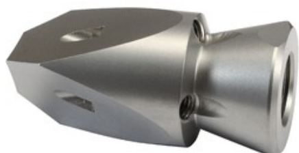
Vysokotlaká kanalizační tryska 350bar 1/4" ST-49 frézovací 4+4 (060) 50mm