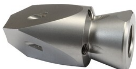
Vysokotlaká kanalizační tryska 350bar 1/4" ST-49 frézovací 4+4 (085) 50mm