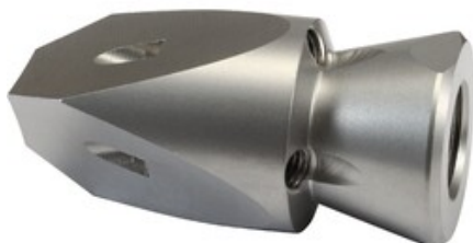
Vysokotlaká kanalizační tryska 350bar 1/4" ST-49 frézovací 4+3 (050) 50mm