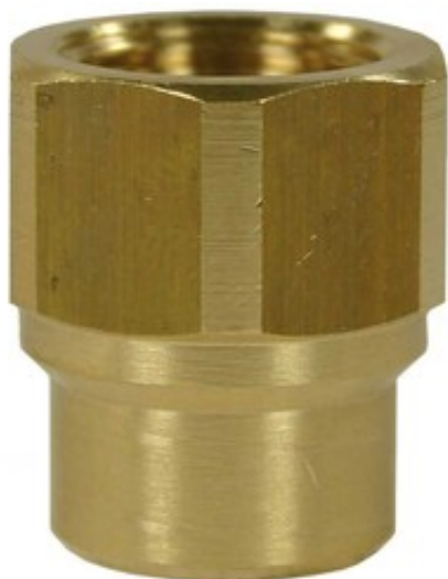
Šroubení 1/4" F - 3/8" F (400bar)