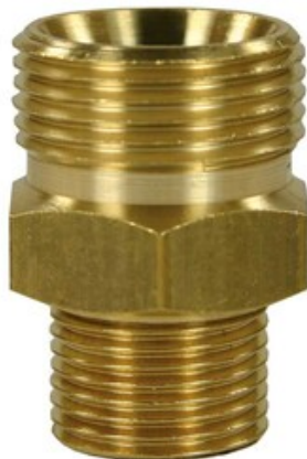
Šroubení M22x1,5 - 1/4" M