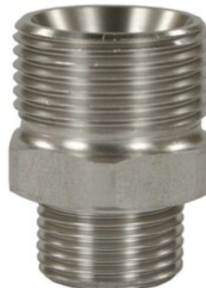
Šroubení M22x1,5 - 1/4" M (500bar)