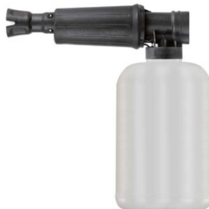
Napěnovací nástavec ST-73.1 s nádobkou 2l (tryska 1.80)