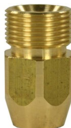
Vysokotlaké šroubení M22x1.5 - 1/4"F Kränzle