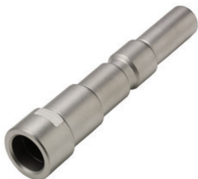
Vsuvka pro rychlospojku - připojení vysokotlaké pistole Nilfisk 1/4" F