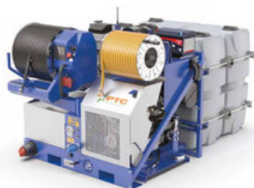
PTC Moses 75/150