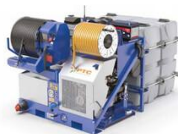
PTC Moses XL 102/150