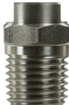
Vysokotlaká tryska plochá 1/4" 15015 (700bar)