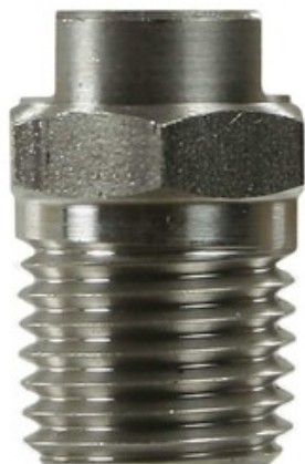
Vysokotlaká tryska plochá 1/4" 15055 (700bar)