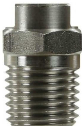
Vysokotlaká tryska plochá 1/4" 15020 (700bar)