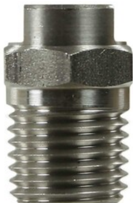
Vysokotlaká tryska plochá 1/4" 15030 (700bar)