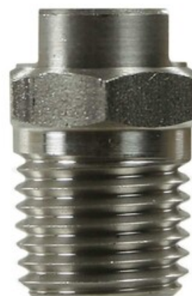
Vysokotlaká tryska plochá 1/4" 15085 (700bar)