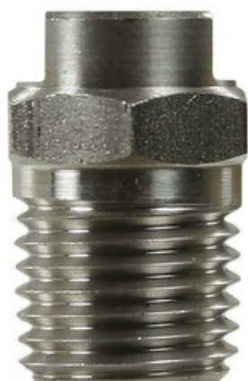
Vysokotlaká tryska plochá 1/4" 15090 (700bar)