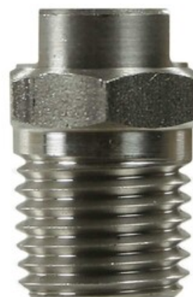
Vysokotlaká tryska plochá 1/4" 15010 (700bar)