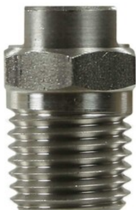
Vysokotlaká tryska plochá 1/4" 15025 (700bar)