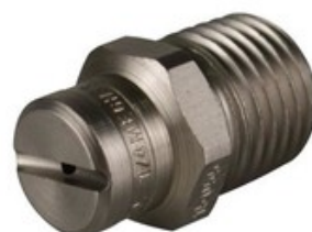
Vysokotlaká tryska plochá 1/4" 15070