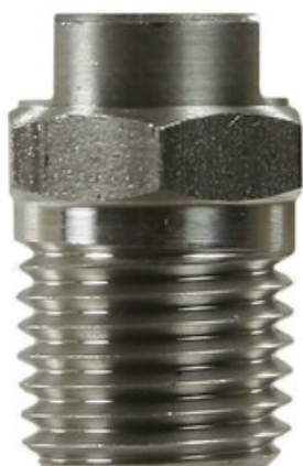
Vysokotlaká tryska plochá 1/4" 15034 (700bar)