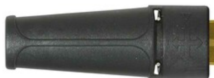
Vysokotlaká tryska Vario 1/4\"/> 045 (200bar)