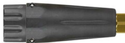
Napěňovací vysokotlaká tryska ST-75 1.7