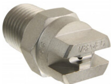
Vysokotlaká tryska plochá 1/8" 25060 (400bar)