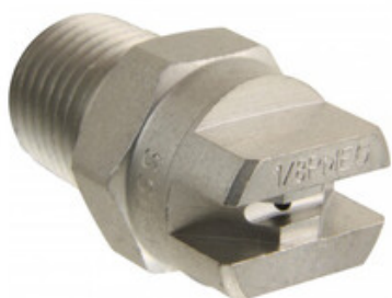
Vysokotlaká tryska plochá 1/8" 25090 (400bar)