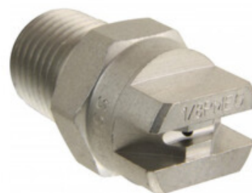
Vysokotlaká tryska plochá 1/8" 25100 (400bar)