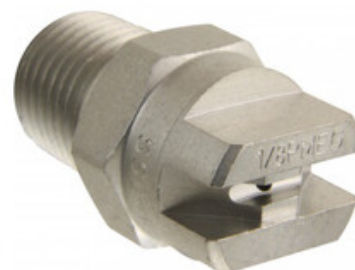
Vysokotlaká tryska plochá 1/8" 25040 (400bar)