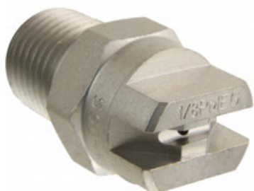
Vysokotlaká tryska plochá 1/8" 25030 (400bar)