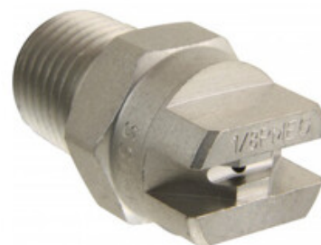
Vysokotlaká tryska plochá 1/8" 25085 (400bar)