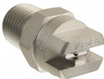
Vysokotlaká tryska plochá 1/8" 25065 (400bar)