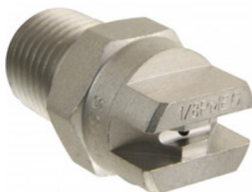
Vysokotlaká tryska plochá 1/8" 25035 (400bar)