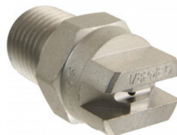
Vysokotlaká tryska plochá 1/8" 25070 (400bar)