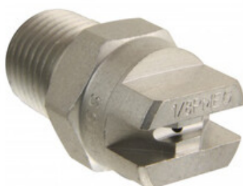
Vysokotlaká tryska plochá 1/8" 25050 (400bar)