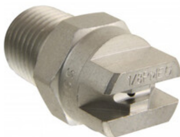
Vysokotlaká tryska plochá 1/8" 25080 (400bar)