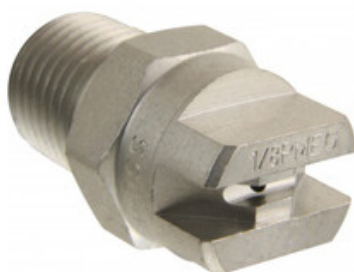
Vysokotlaká tryska plochá 1/8" 25020 (400bar)