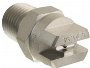
Vysokotlaká tryska plochá 1/8" 25075 (400bar)