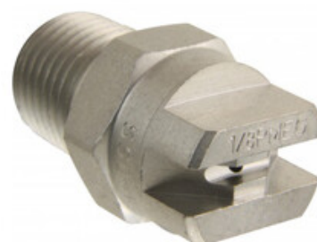
Vysokotlaká tryska plochá 1/8" 25055 (400bar)