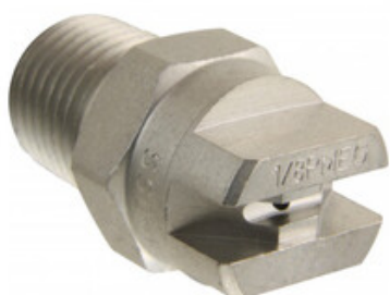
Vysokotlaká tryska plochá 1/8" 25045 (400bar)