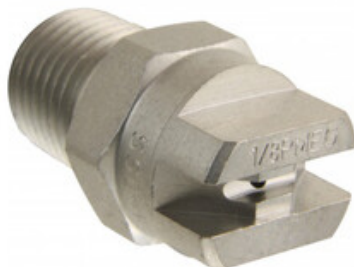
Vysokotlaká tryska plochá 1/8" 25035 (400bar)