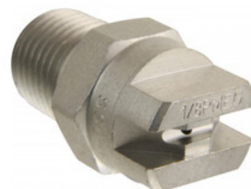
Vysokotlaká tryska plochá 1/8" 25100 (400bar)