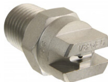
Vysokotlaká tryska plochá 1/8" 25055 (400bar)