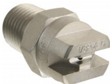
Vysokotlaká tryska plochá 1/8" 25065 (400bar)