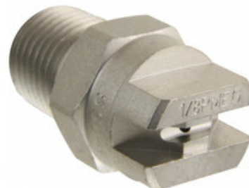
Vysokotlaká tryska plochá 1/8" 25040 (400bar)