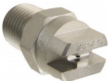
Vysokotlaká tryska plochá 1/8" 25045 (400bar)