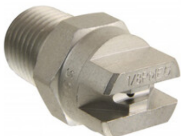
Vysokotlaká tryska plochá 1/8" 25060 (400bar)