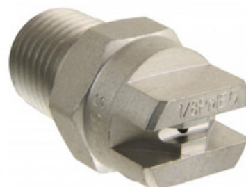
Vysokotlaká tryska plochá 1/8" 25070 (400bar)