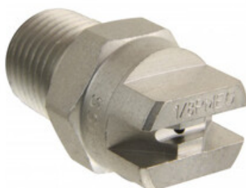
Vysokotlaká tryska plochá 1/8" 25020 (400bar)