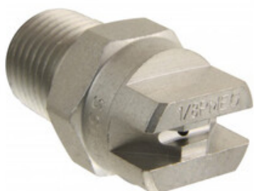
Vysokotlaká tryska plochá 1/8" 25090 (400bar)