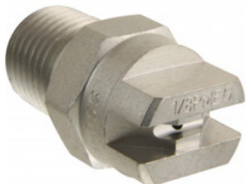
Vysokotlaká tryska plochá 1/8" 25030 (400bar)