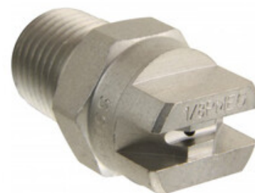
Vysokotlaká tryska plochá 1/8" 25085 (400bar)