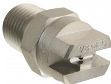
Vysokotlaká tryska plochá 1/8" 25050 (400bar)