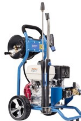
Nilfisk MC 5C-280/1000 PEXT