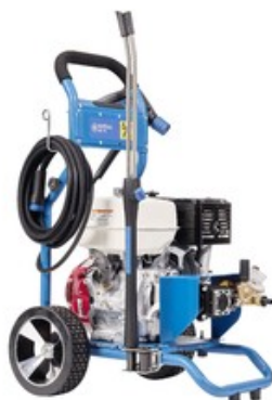
Nilfisk MC 5C-280/1000 PE