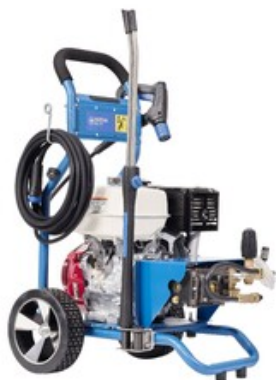
Nilfisk MC 5M-280/1100 PE