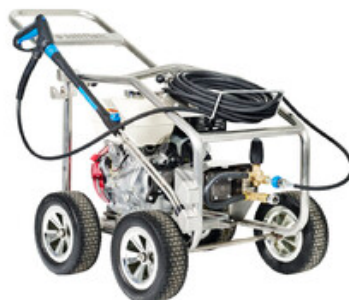
Nilfisk MC 5M-290/1050 PE CAGE