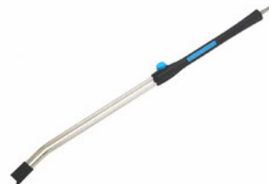
Nilfisk Tornado Plus nástavec - 1000mm