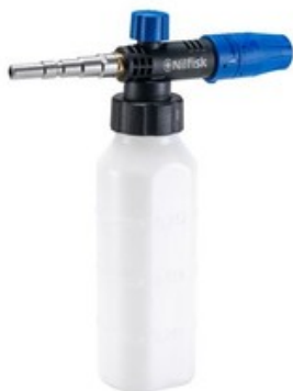
Nilfisk napěňovací nástavec Vario s nádobkou 1l (540-960 l/hod)