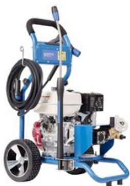
Nilfisk MC 5C-240/940 PE