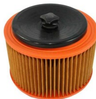
Filtrační patrona - válcový filtr s držákem Gisowatt PC 50 - PC 70 "M"