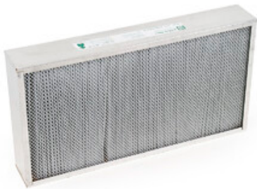
Polyesterový panelový filtr Ultra Web pro zametací stroje Nilfisk SW5500 a Floortec R 985