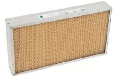
Papírový panelový filtr Ultra Web pro zametací stroje Nilfisk SW5500 a Floortec R 985