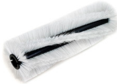
Hlavní válcový kartáč pro zametací stroje Nilfisk 360x850mm PPL 0,8