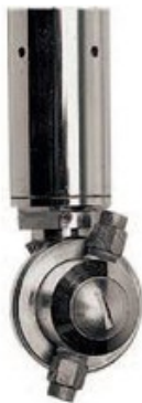
Nilfisk TRK 25 (rotační tryska pro čištění nádob)