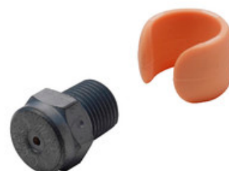
Vysokotlaká tryska Nilfisk Tornado Plus 1200