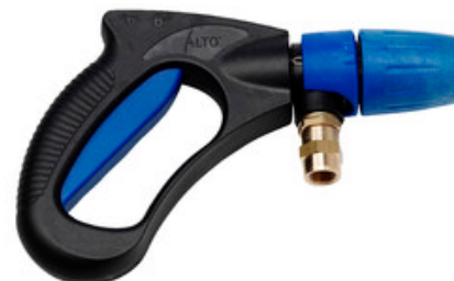
Nilfisk Ergo 3000 - pistole s aretací