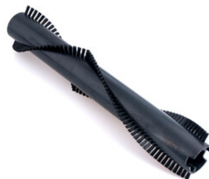
Rotační kartáč pro vysavač Nilfisk VU500-15