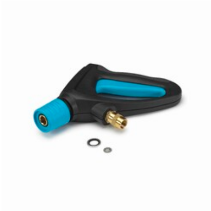
Nilfisk Ergo 2000 Standard - vysokotlaká pistole s otočnou spojkou