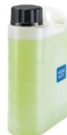
Nádobka pro napěňovací nástavec Nilfisk Vario (2,5L)