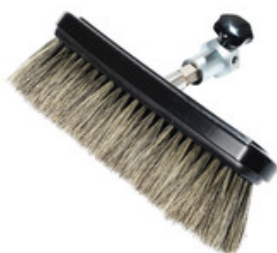
Nilfisk průtočný mycí kartáč