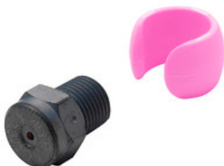
Vysokotlaká tryska Nilfisk Tornado Plus 0750