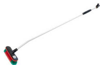
Nilfisk průtočný mycí kartáč s nástavcem 1550mm