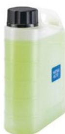
Nádobka pro napěňovací nástavec Nilfisk Vario (2,5L)