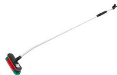
Nilfisk průtočný mycí kartáč s nástavcem 1550mm