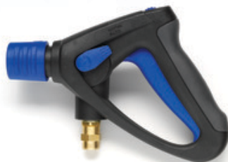
Nilfisk Ergo 2000 VarioPress - pistole