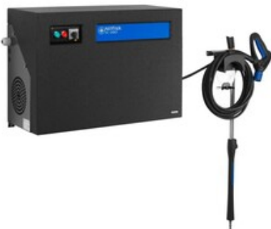
Nilfisk SC UNO 8P-180/2000