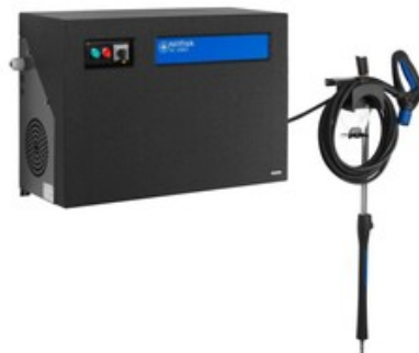
Nilfisk SC UNO 8P-160/2500