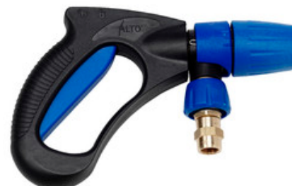
Nilfisk Ergo 3000 VarioPress - pistole s aretací