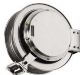
Nilfisk nerezový samonavíjecí buben pro vysokotlakou hadici