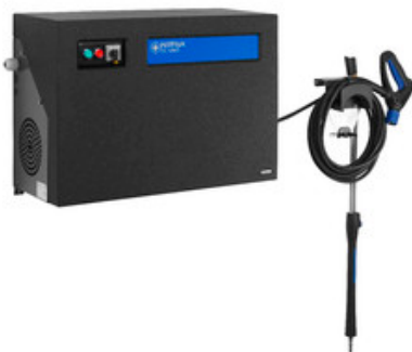
Nilfisk SC UNO 5M-200/1050