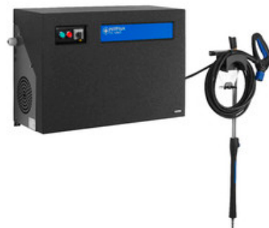
Nilfisk SC UNO 6P-170/1610