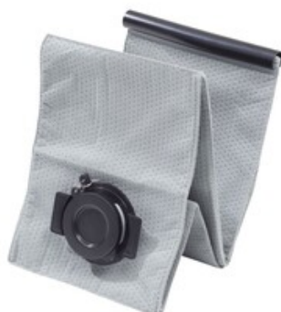
Nilfisk filtrační sáček pro opakované použití pro ATTIX 33, ATTIX 44 (1ks)