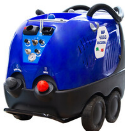
Mazzonei ST4000 Vacuum