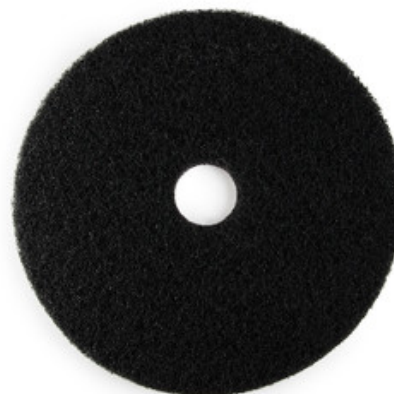
Podlahový PAD premium - černý 17" (430mm)