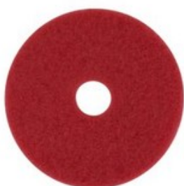
Podlahový PAD premium - červený 17" (430mm)