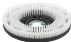
Diskový kartáč TSM 450mm PPL 0,6