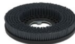
Diskový kartáč TSM 450mm TYNEX 1,2