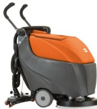
TSM Grande Brio 45 BT