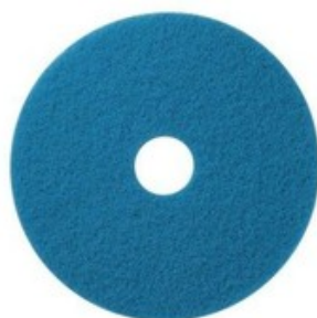
Podlahový PAD premium - modrý 17" (430mm)