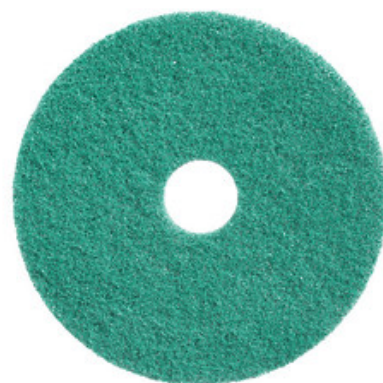
Podlahový PAD premium - zelený 17" (430mm)