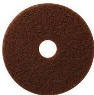
Podlahový PAD premium - hnědý 17" (430mm)