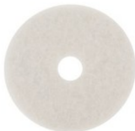
Podlahový PAD premium - bílý 17" (430mm)