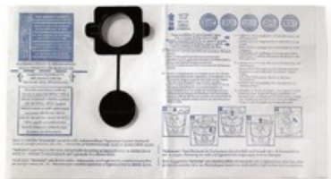
Filtrační sáčky Gisowatt PC 35 - PC 50 (5ks)