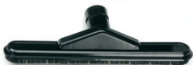
Průmyslová podlahová hubice se štětinami Gisowatt DN45