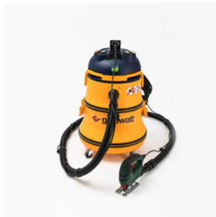
Gisowatt PC 50 Tools Evolution M