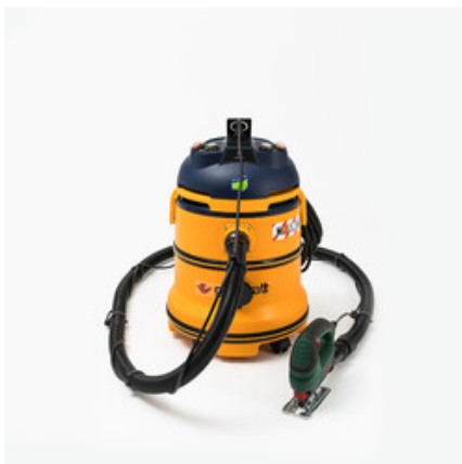
Gisowatt PC 35 Tools Evolution M