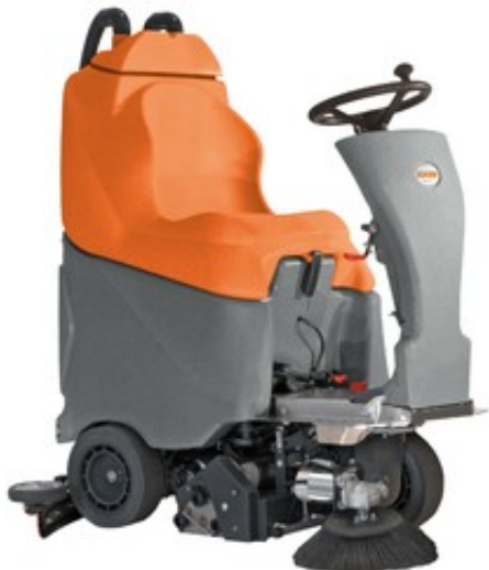
TSM Grande Brio Ride ON 75-C62 (1 postranní kartáč)